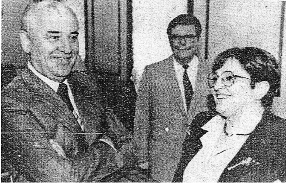
Gorbaçov ve Papatia: Nikita Kruşçev'in "cesur çocukları" (Moskova, Haziran 1991)

* Nikandros Kepesis , 1940-41 savařına yedek teğmen olarak katıldı. İşgalcilere karşı mücadeleye ilk katılanlardan biriydi. Yunan Kurtuluş Ordusunun (ELAS) 6. Bağımsız Pire Birlięinin komutanı oldu. 1930'da öğrenciyken OKNE (Yunanistan KP'nin gençlik örgütü) üyesi ve 1936'da Yunanistan KP üyesi oldu. 1944'te Pire Parti Örgütünün Sekreteryasının üyesi ve 1946'da Atina Parti Örgütü ikinci sekreteri oldu. 1950'de hapisteyken 3. Konferansta YKP Merkez Komitesine seçildi. 11. Kongreye kadar bütün konferanslarda yeniden seçildi. Yurtsever ve partizan etkinlięi nedeniyle yoğun takibata uğradı. 22 yılını hapishanelerde ve toplama kamplarında geçirdi. İşgale karşı mücadeleye katkısı ve özellikle de 12-13 Ekim 1944 muharebelerindeki rolü nedeniyle, Parti tarafından onurlandırıldı ve PEEA (Ulusal Kurtuluş Politik Komitesi, Nazi işbirlikçisi hükümete karşı kurulan "Dağ Hükümeti" olarak da bilinir) temsilcisi oldu. Geçmişte Yunan parlamentosunda YKP'den milletvekillięi de yapmıştır. Emektar komünist savařçı yoldaş Nikandros Kepesis 3 Haziran 2009'da aramızdan ayrılmıştır.